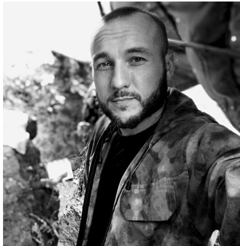
Военный медик Поэт представлен к ордену Мужества и медали «За спасение погибавших»

Настоящей неожиданностью для «Вечерки» стала встреча на передовой с потомком выдающегося литератора, с произведениями которого знаком каждый школьник.