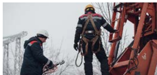
Специалисты выполняют свои должностные обязанности

Зона обслуживания Торезского городского РЭС – это многокилометровые воздушные и кабельные линии, которые паутиной проходят по территории города, поселки Пелагеевка и Рассыпное.