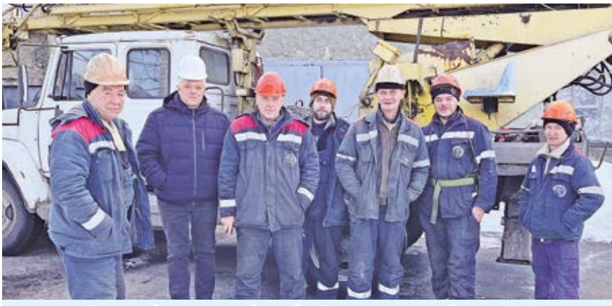
Производственные бригады Торезского городского РЭС

Из-за обледенения проводов, обильных осадков и сильного ветра произошел обрыв линий. Люди обратились в РЭС, диспетчерскую службу администрации города, писали посты в соцсетях. Но мало кто задумывался, как устроена работа системы, обеспечивающей нам электричество.